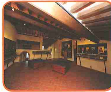
MUSEO DELLE ICONE RUSSE "F. BIGAZZI"

L'antico Palazzo Pretorio di epoca medievale ospita al suo interno due Musei: