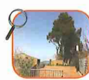
La Castellaccia (punto panoramico)