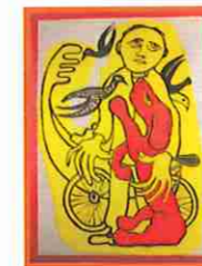
MUSEO COLLEZIONE INCISIONI E LITOGRAFIE DONAZIONE VITO MERLINI

Dove: Palazzo Pretorio Piazza del Popolo n. 5, Peccioli (Pi) Tel. +39 0587 672877